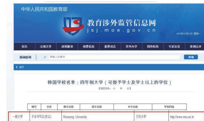
中国教育部教育涉外监管信息网