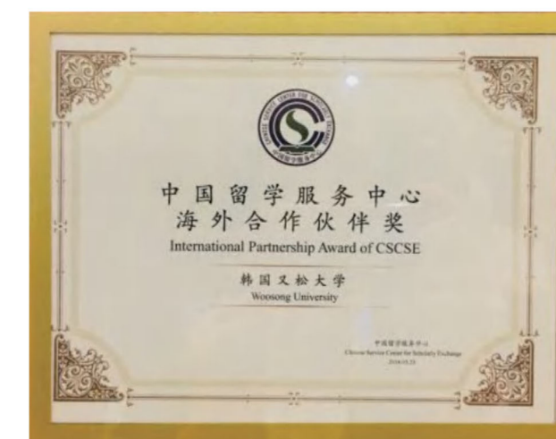
中国教育部留学服务中心海外合作伙伴奖

注：持海外学历者需提供与之匹配的成绩单 学生提供的申请资料将按照韩国教育部要求，接受严格的审查如有虚假将取消其申请资格